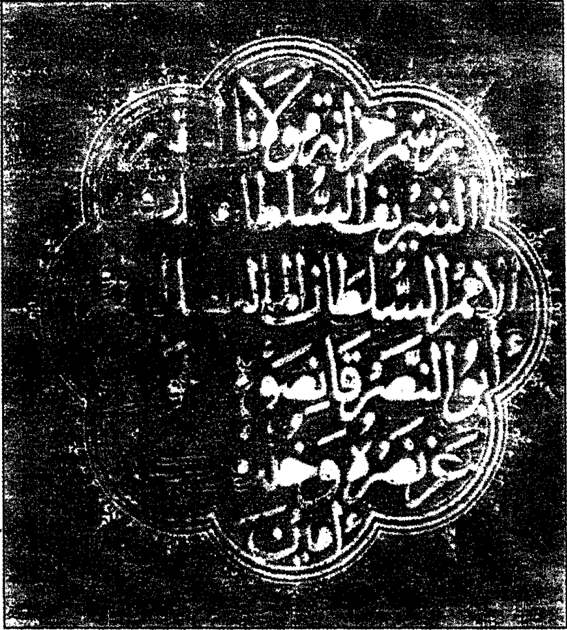
صفحة العنوان من كتاب الشاهنامه التركية